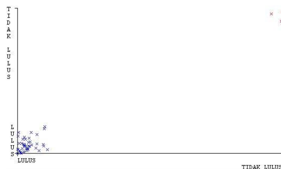
Gambar 3. Grafik Visual Hasil Classify

Dari hasil perhitungan Klasifikasi data traning tersebut menghasilkan perbedaan hasil dari tabel ke 9 hingga tabel 10. Hasil tabel ke 9 berjumlah 43 yang lulus, tabel ke 10 berjumlah 18 yang lulus dengan menggunakan percentage split 60% , tabel 11 berjumlah 13 yang lulus menggunakan percentage split 70% , sedangkan tabel ke 12 berjumlah 8 yang lulus menggunakan percentage split 80% . Berikut tampilan dari grafik hasil classify pada gambar 3 sebagai berikut: