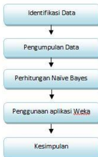
Gambar 1. Tahapan Proses Penelitian

Pada uraian ini penulis menampilkan beberapa tahapan – tahapan proses penelitian yang dapat dilihat pada gambar 1 sebagai berikut: