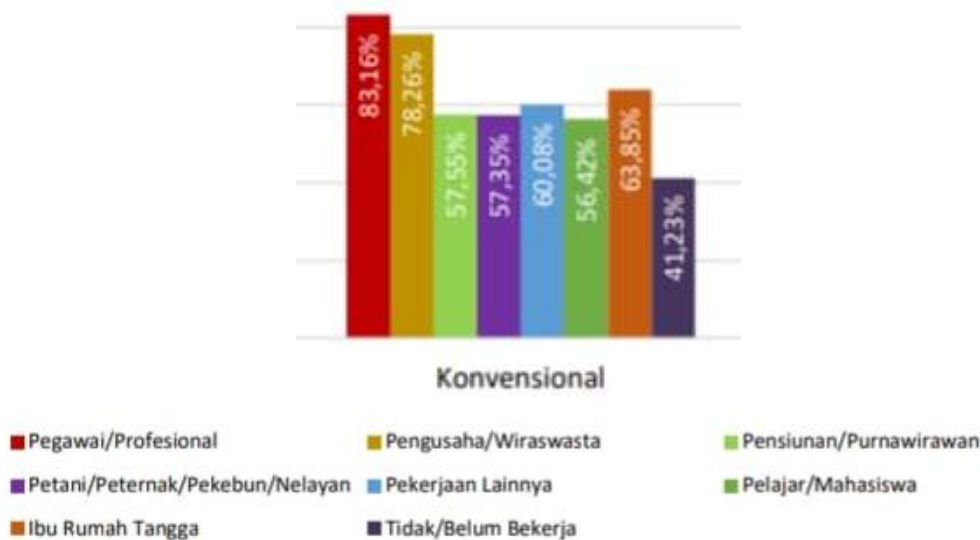
Gambar 1.1 Hasil Data OJK

Berdasarkan gambar 1.1, tingkat literasi keuangan mahasiswa termasuk yang paling rendah dibandingkan kelompok lainnya, meskipun masih lebih tinggi dari kelompok yang tidak/belum bekerja.