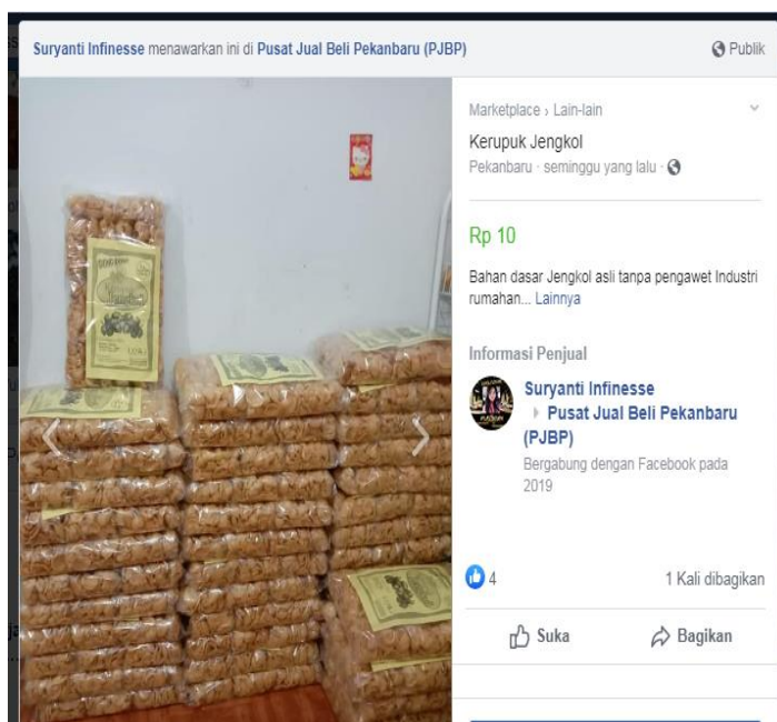
Gambar 5. Pemasaran Kerupuk Jengkol melalui Facebook Pusat Jual Beli Pekanbaru (PJBBP)