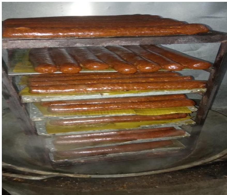
Gambar 1. Proses Kukus Bahan Baku

dilakukan masih tergolong sederhana dan dari aspek pemasaranpun masih sangat sederhana. Produk dikemas dengan cara kuno yaitu hanya menggunakan kemasan plastik yang distaples dan belum menggunakan label serta kardus biasa dengan label fotokopi (Sulistiyandari et al., 2017).