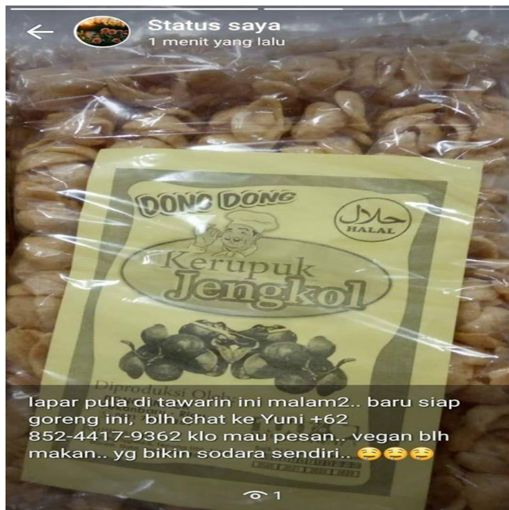
Gambar 4. Pemasaran Kerupuk rasa Jengkol melalui media sosial Whattshap