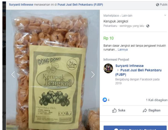
Gambar 6. Pemasaran Kerupuk Jengkol melalui Facebook Pusat Jual Beli Pekanbaru (PJBBP)