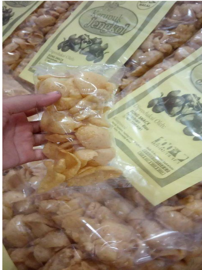
Gambar 3. Kerupuk Rasa Jengkol siap dibungkus dan untuk dipasarkan

Proses pengeringan dilakukan selama dua hari atau lebih tergantung cuaca, proses pengeringan ini dilakukan setelah kukusan selesai dilakukan dan dilanjutkan dengan pemotongan.